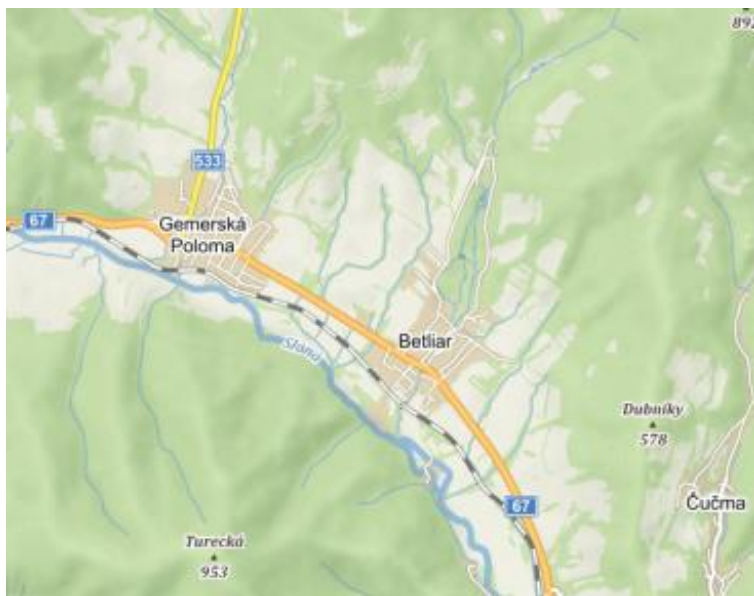
Obrázok 1 Mapa polohy obce

Obec Betliar sa nachádza v juhovýchodnej časti Slovenského rudohoria na náplavovom kuželi Betliarskeho potoka a na nive rieky Slaná. Územie obce sa rozprestiera medzi Volovskými vrchmi a vrchom Turecká v Slovenskom rudohorí. K obci patrí aj osada Nižná. Kataster obce Betliar susedí na západnej strane s obcou Gemerská Poloma, na juhovýchodnej strane s obcou Čučma, na južnej strane s obcou Rudná a s mestom Rožňava a na severnej strane s obcou Henclová.