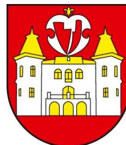
Obrázok 2 Erb obce

Erb obce Betliar tvorí v červenom štíte strieborný dvojvežový zlatostrechý, zlatookný a zlatobranný kaštieľ, nad ním malou zlatou ľaliou prevýšený strieborný renesančný štítok s dvoma červenými sklonenými, ostrím privrátenými radlicami.